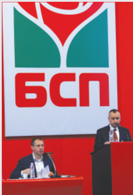
новата Програма на Българската социалистическа партия ”, представя новите направените в нея редакционни

По точка трета от дневния ред Георги Пирински запозна членовете на ВС на БСП с извършената работа в изпълнение на решението на 47-ия конгрес на БСП „За