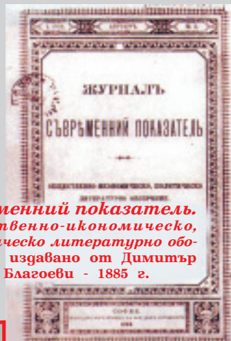
Съвременний показател. Общественно-икономическо, политическо литературно обозрение , издавано от Димитър и Вела Благоеви - 1885 г.